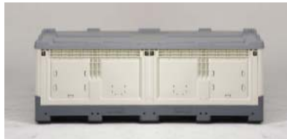
Ekokem-muoviasia (LM 1200). Mitat sentseissä 225 x 100 x 98,7.