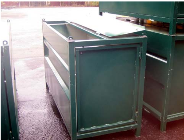
EU-standardin mukainen teräsastia

Lamppulaatikat sijoitetaan vastaanottajan omiin tiloihin, jotka ovat lukittavissa . Silloin, kun Elkerin kontissa on tilaa myös lamppulaatikoille, sitä voidaan tarvittaessa käyttää sijoituspaikkana.