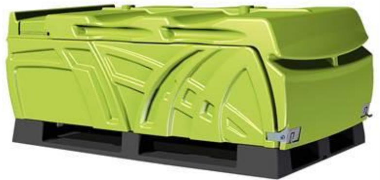
Pystymallin loisteputkilaatikko ja Feeber